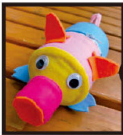
ブタさん貯金箱 を作ろう!