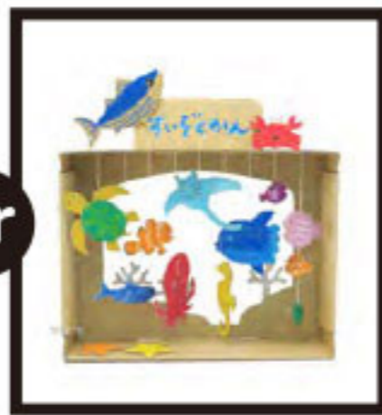
ダンボール水族館 を作ろう!